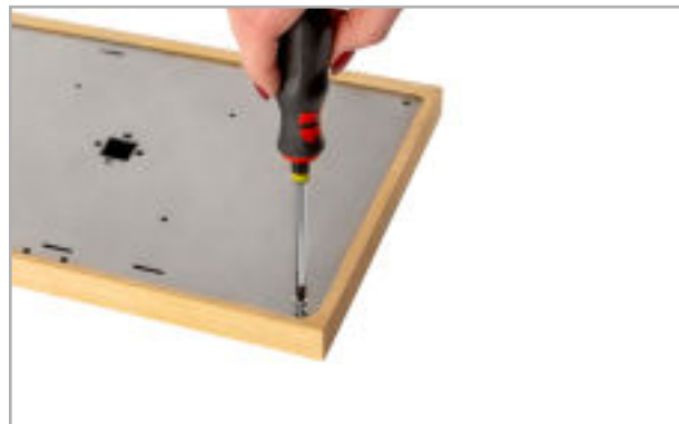
Abb. 2: Schrauben am Gehäuse lösen