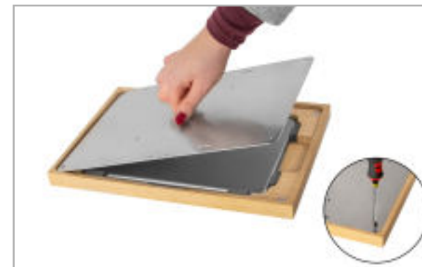
Abb. 5: Gehäuse schließen