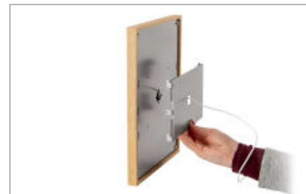
Abb. 6: Befestigungsplatte anbringen