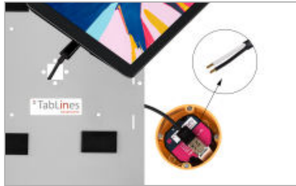
Abb. 7: Tablet mit optionalem Netzteil verbinden