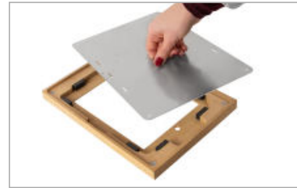
Abb. 3: Gehäuse vom Rahmen entfernen

Achtung: Die Schrauben werden im Schritt 2.5 wieder benötigt, um das Gehäuse zu befestigen.