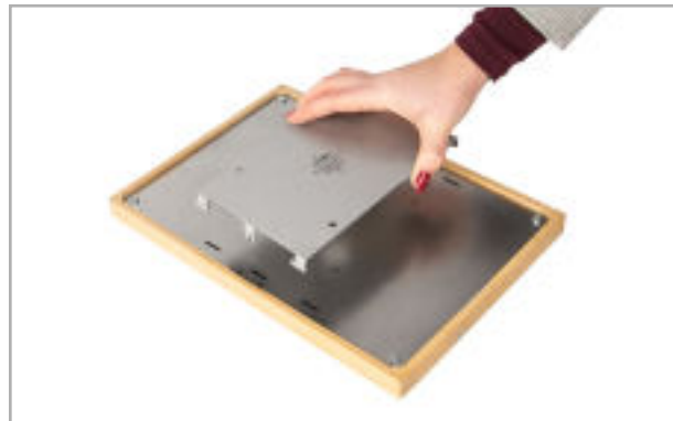
Abb. 1: Entfernen der Befestigungsplatte