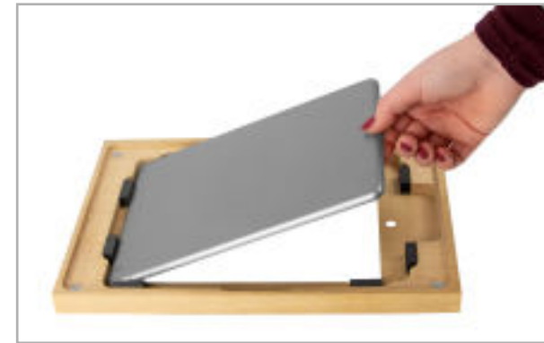
Abb. 4: Einlegen des Tablets