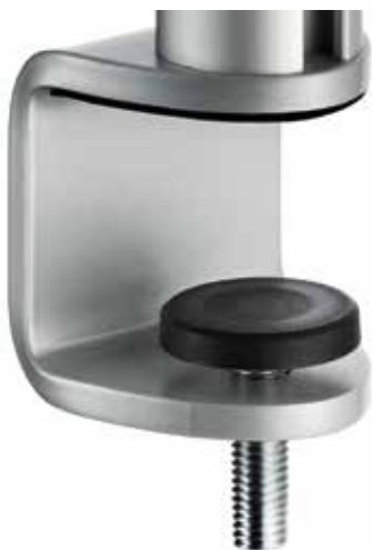
NOVUS MY mit Systemzwingung (14 - 40 mm)