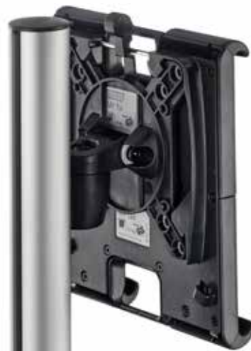
Rückansicht von NOVUS MY one + NOVUS MY tab