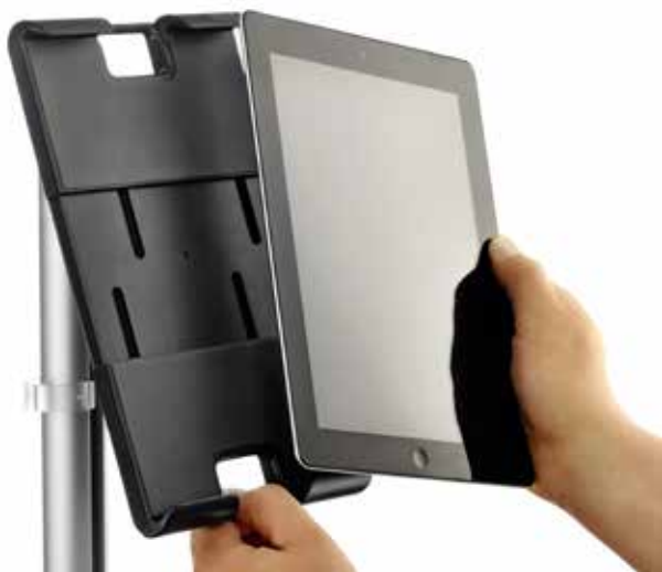
Komfortables Einlegen eines Tablets im Hochformat.