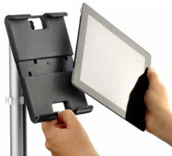
Komfortables Einlegen eines Tablets im Querformat.