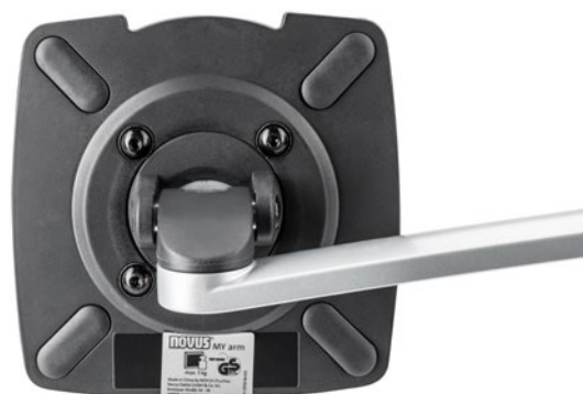
MY fix 2.0, schwarz