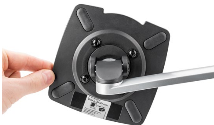
MY fix 2.0, schwarz