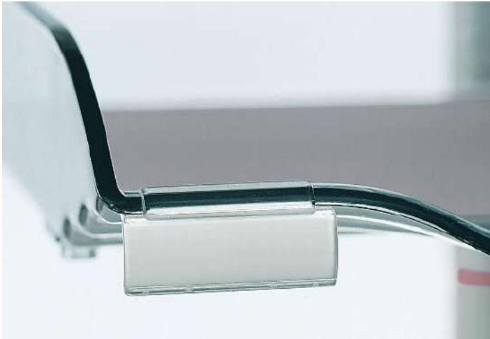
Büroorganisation Schalen-Sets NOVUS CopySwinger Duo III