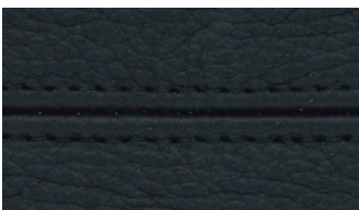
Corvara Midnight with Noir stitching