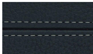
Corvara Midnight with Light Grey stitching

*Printed colors shown may not perfectly match actual leather or stitch colors. Please review a leather swatch or stitch sample before placing an order.