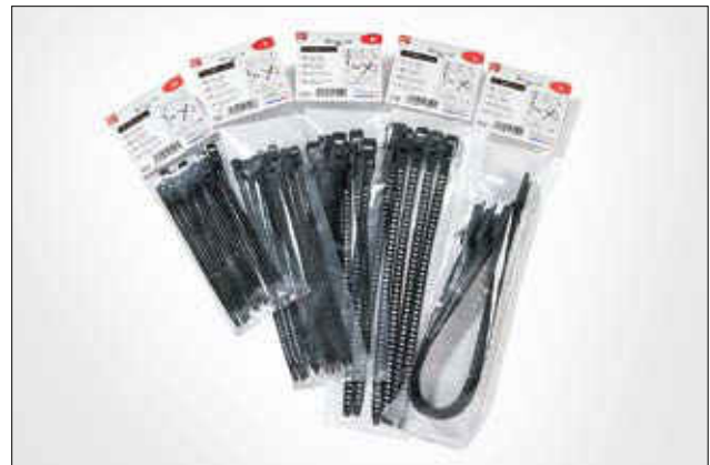
Die SOFTFIX-Familie ist in praktischen Kleinverpackungen erhältlich.