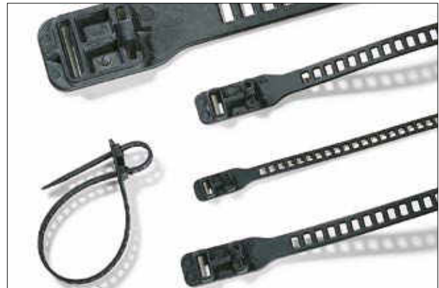
Elastisch und vielseitig einsetzbar: die SRT- und SOFTFIX-Kabelbinder.