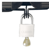
Halterungen und Flügelschloss