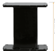
Extender für Aluminiumhubsäulen