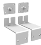
2 verzinkte Wandhalterungen