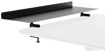
6000-0007-9000 Scandinavian Matte Black