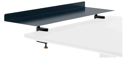
6000-0007-5008 Nordic Dark Blue