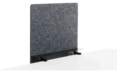
6000-0024-9000 Scandinavian Matte Black

Design by Hans Thyge & Co. // Hergestellt von PJ Production