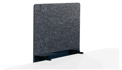
6000-0024-5008 Nordic Dark Blue